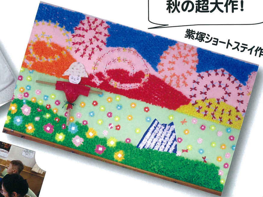
紫塚ショートステイ作