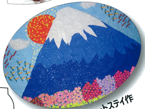
紫塚ショートステイ作