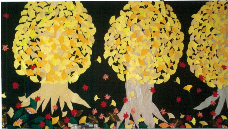
紫塚ショートステイ作