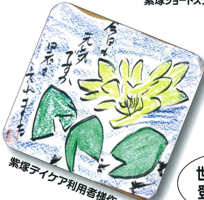
紫塚デイケア利用者様作