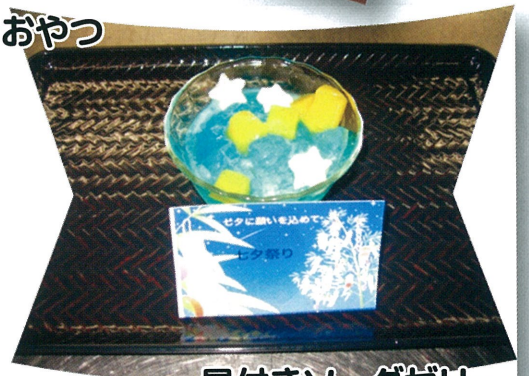
星付きソーダゼリー