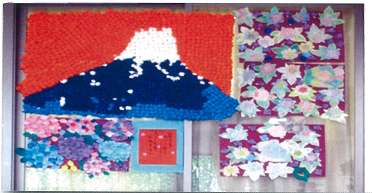
クリニックデイケア作