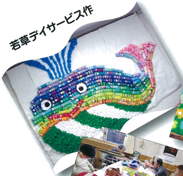
若草デザイナービス作