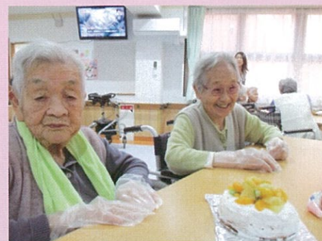
ケーキ作り等のイベントを 行っています！ 老若男女甘味処は人気です♪