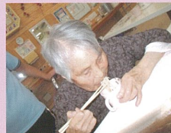
流しそうめん大会！ 竹も割っていて本格的です♪