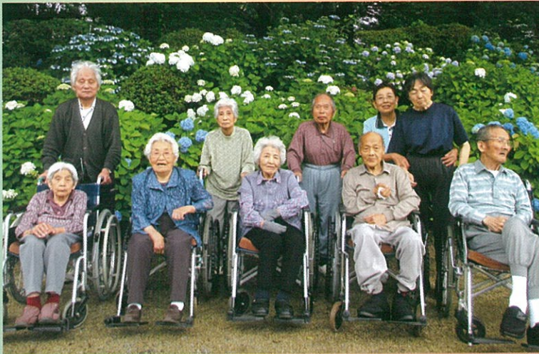
綺麗に咲いたアジサイの前で記念撮影!