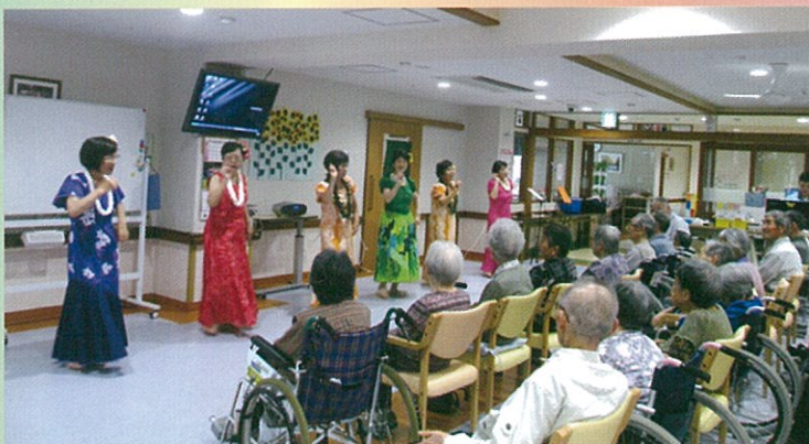
身も心もゆ〜らゆら〜