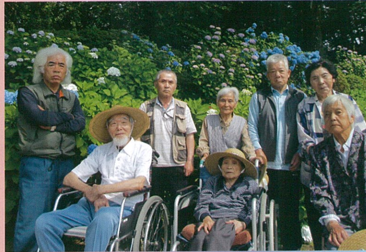
風情を楽しみました!