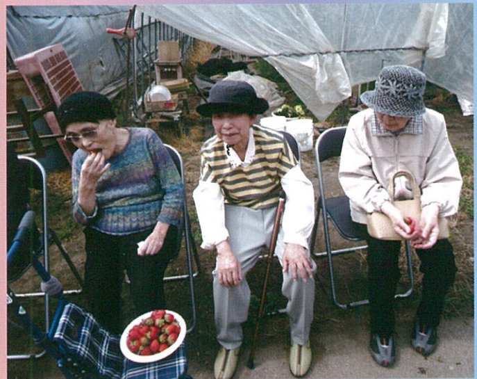
あま〜いイチゴに、食べる手が止まりません!