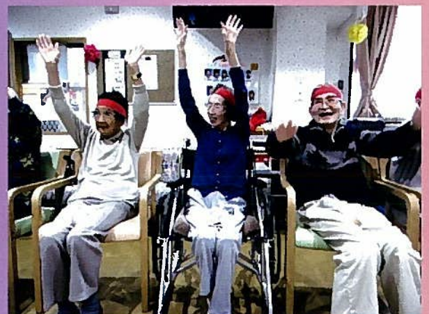
紅組、白組。どっちも優勝です！