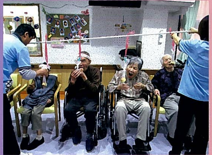
皆さん、一所懸命です！