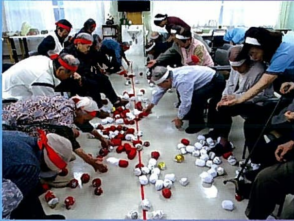
スポーツの秋！ 各部署では、運動会が開かれました！