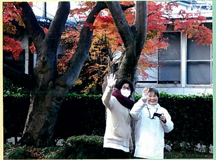
綺麗な紅葉に、心も色付く