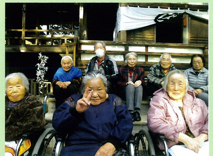
力強くお餅を搗きます！ おいしいお餅ができそうです