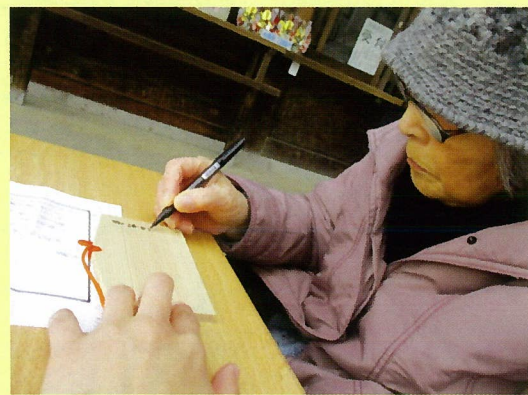
絵馬に願いを込めて！