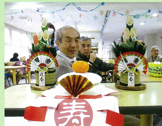
鏡餅と一緒に撮影！ 書初めも行いました