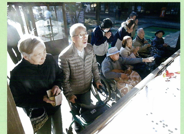
皆さんで、初詣に行きました！ 今年1年、良い年でありますように