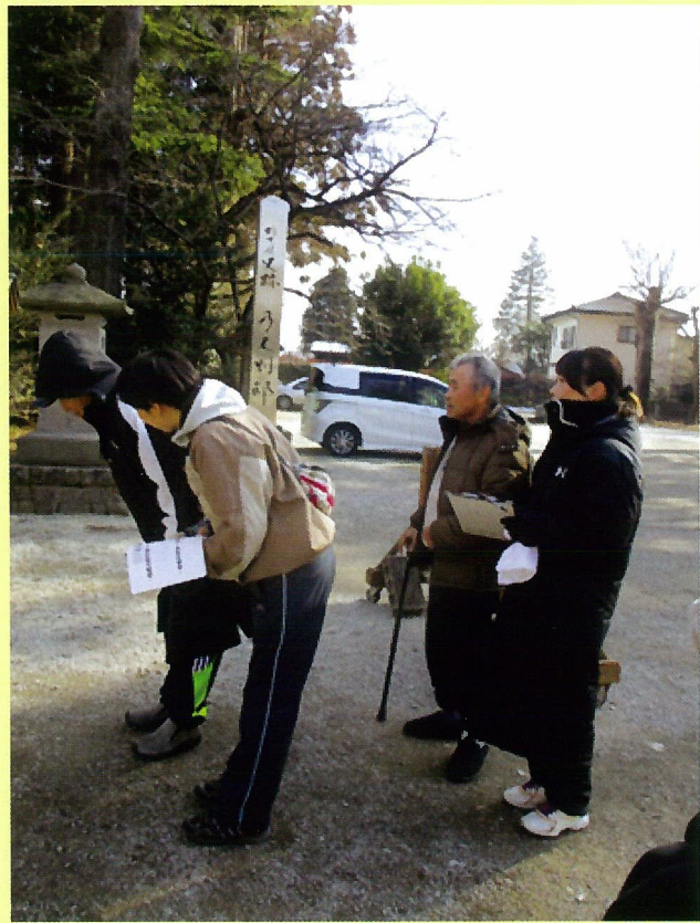
神社に初詣！ 皆さん、この日の為に リハビリを頑張りました！