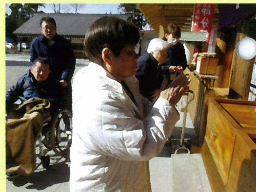
今年1年の幸せを願って、 お祈りします！