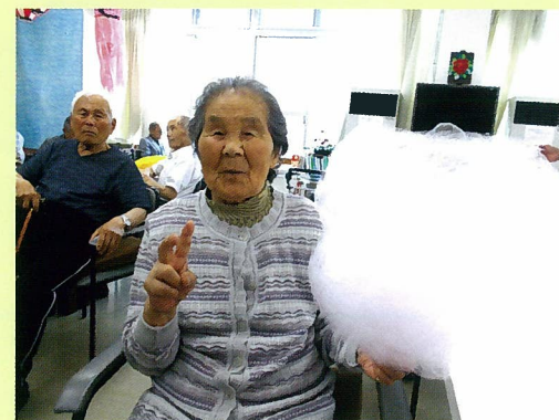
夏祭りを行いました！大きなわたあめに笑顔がこぼれます！