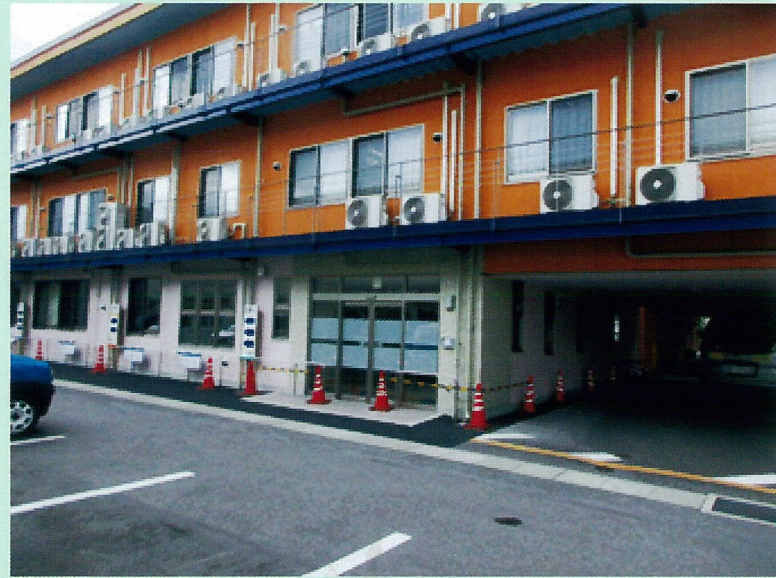
以前の駐車場のスペースに外来診療所を移転しました。