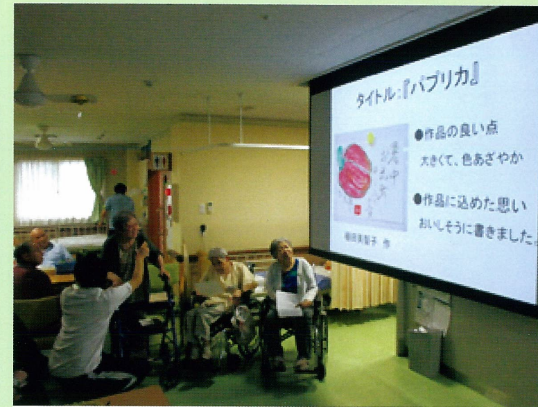
リハビリの一環として「絵手紙」を作成しました。単に制作だけで終わらず、作品の発表と実際に郵便協に手紙を出しにいきました！