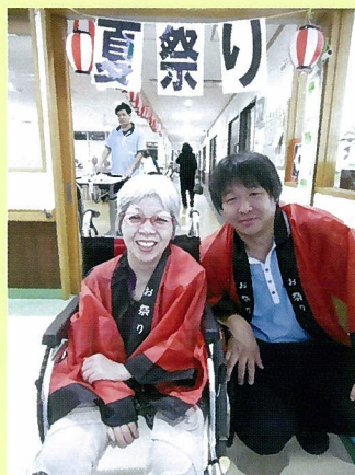
楽しい夏祭りを行ないました！利用と職員が一緒になって祭りを楽しみました！