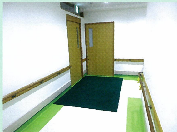
内装も患者様、利用者様が使い易い様に作りました。