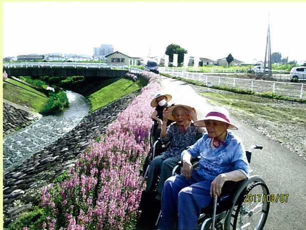
きれいな花畑で、心もリハビリ中です！