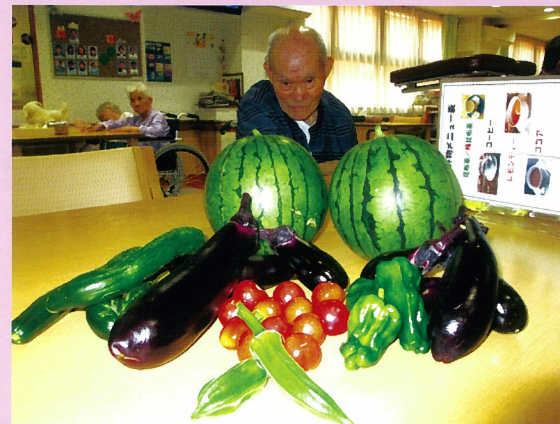
利用者様の愛情が詰まった野菜がたくさん収穫できています！