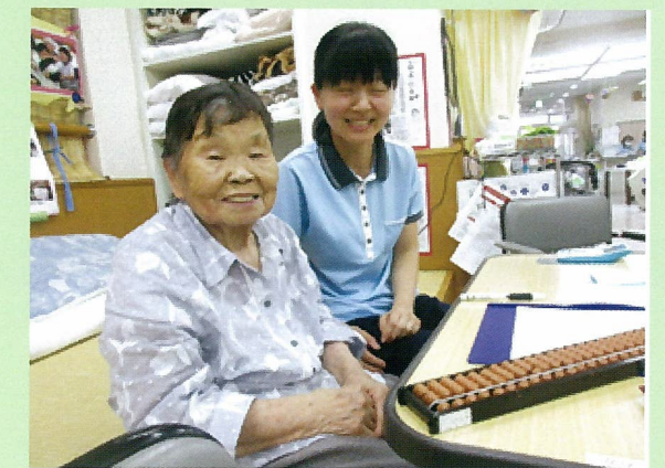
レクレーションの際には、利用者様に司会進行と点数計算をお願いしています。簡単な内容のレクレーションでも、「役割」を決めることで、より効果の高いリハビリになります！