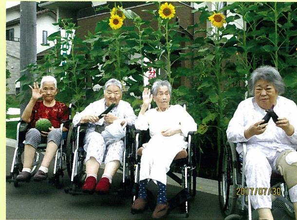
作物の収穫に、ひまわりもにっこりです！