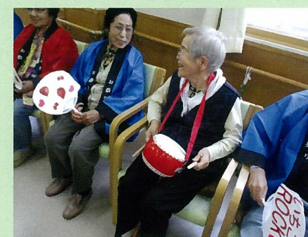
競技だけでなく、応援も頑張ります！

輪投げ大会を開催しました！ 利用者さん達は輪投げの練習を重ね、大会では日頃の成果を存分に発揮しました！