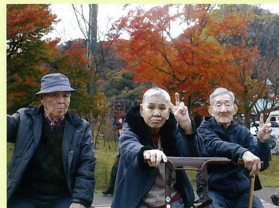
紅葉狩りへ出発！ 綺麗な紅葉に、心が洗われます