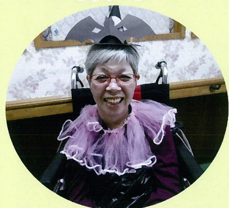
ハッピーハロウィン！ お菓子をくれないと、悪戯しちゃうぞ！