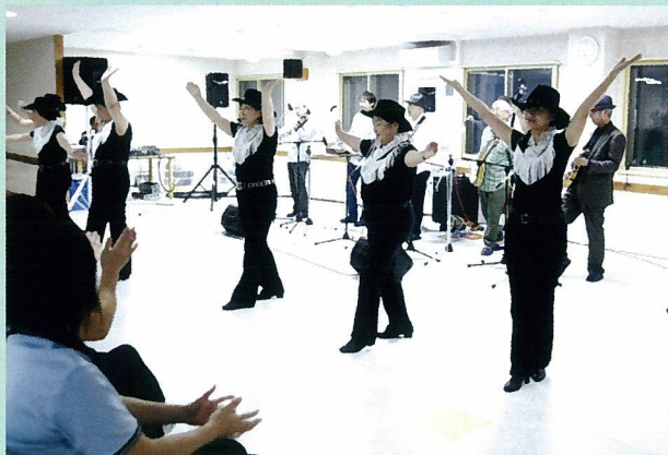
演奏に合わせて、だいなエンジェルズもダンスを披露しました！

は、一九九一年、珍珠へやってきたアメリカのブルーグラス・バンド「レッドウッド・キャニオン・ランブラーズ」の公演に刺激をうけた四名が主体となつて作り上げたバンドだそうです。息の合ったリズムとコーラス