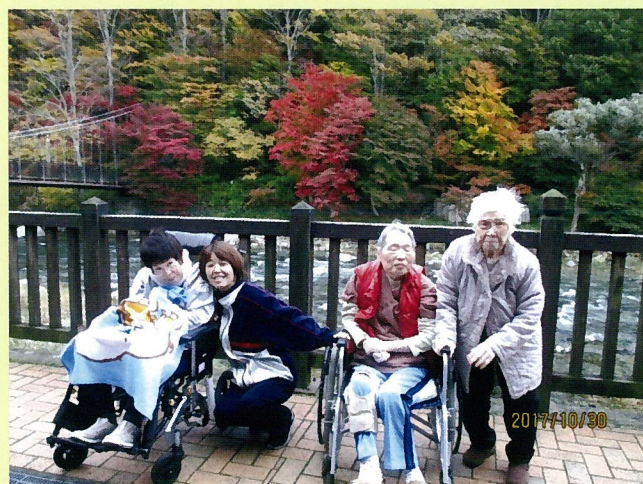
塩原へ紅葉狩りへ行って来ました！