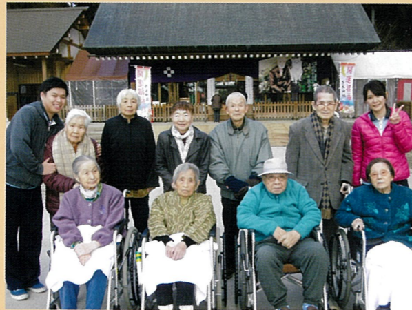
初詣！皆さん、どんなお願いをしたのでしょうか？