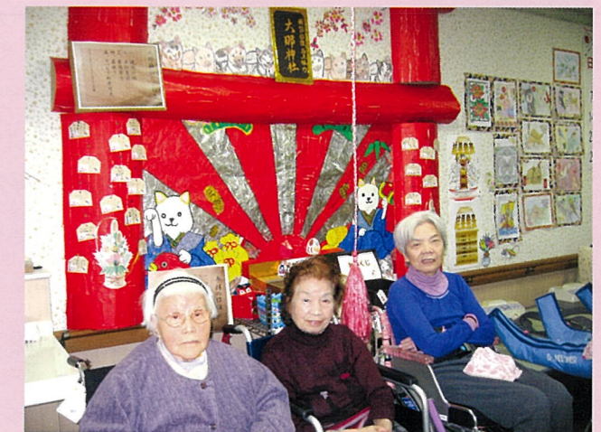
開運だいな神社でおまいりの練習！