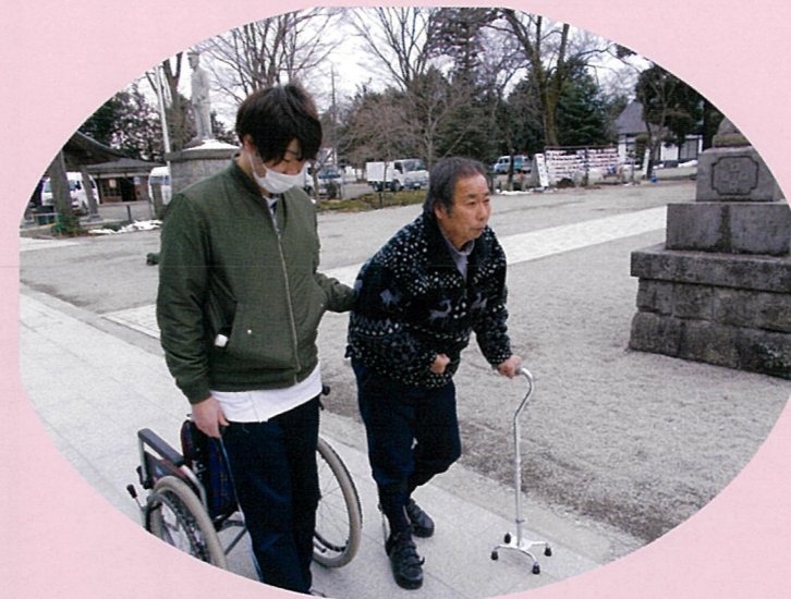
普段、車椅子の人も頑張って歩きます！