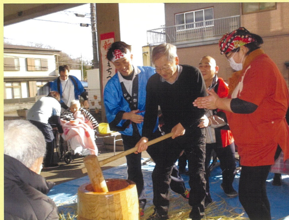
スタッフの手を借りて、お餅をつきます！

二〇一七年の年の瀬に、だいなリハビリクリニックデイケアとだいな紫塚デイケアの利用者様が協力し、合同餅つき大会が行われました。だいなではこのようなイベントもリハビリの一環であると考えられています。利用者様は事前に餅つきをする段取りや、練習を行い、本番に臨みました。リハビリという歩いたり、筋力を強くしたり、関節を動かしたりなどのイメージがあるかもしれませんが、このように楽しみながら全身の運動を行うことは、身体機能だけではなく、認知機能低下の予防にもなるといわれています。