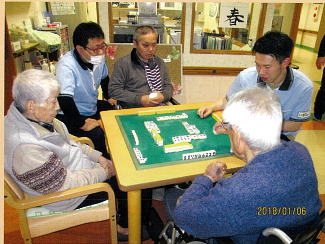
新春、麻雀大会開催です！