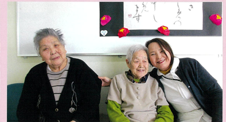
利用者さんと一緒にピース！ クリニックデイケアでは、利 用者様とスタッフ共々、笑顔 が絶えません！