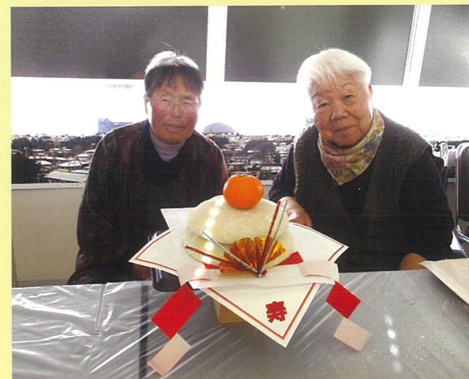
素敵な鏡餅を作りました！

利用者様のついた餅は鏡餅としてだいな法人内のいたるところに飾られ、だいな全体に福を呼び込んでくれました。今年も利用者様に満足度の高いリハビリとサービスを提供できるように、スタッフ一同頑張っていきます。