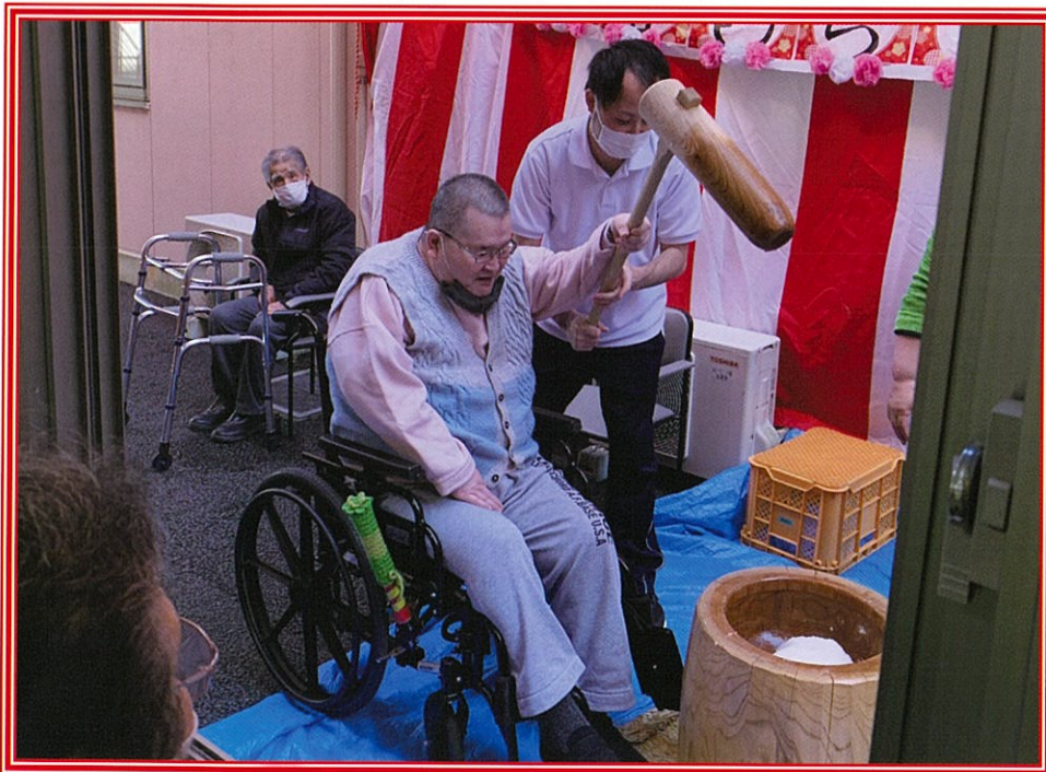
餅がついたら丹精こめて形を整えます。 出来栄はいかがでしたか？